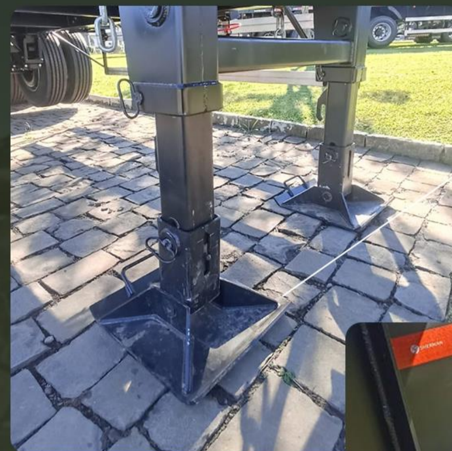
Pé de apoio sapata