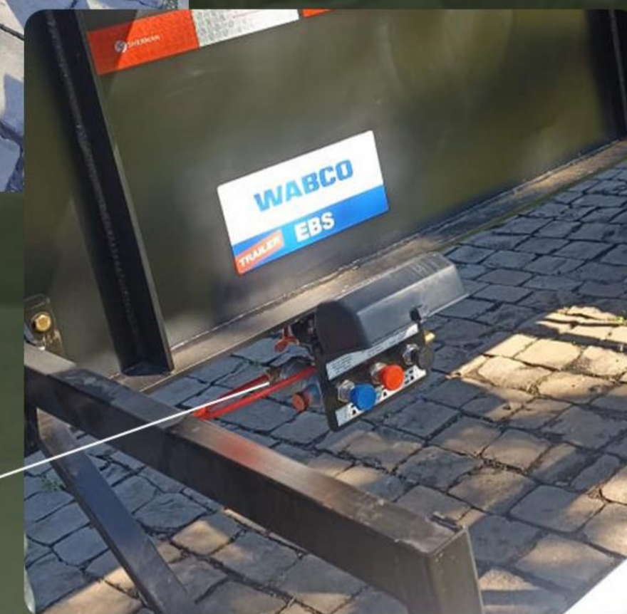
Sistema de freio EBS