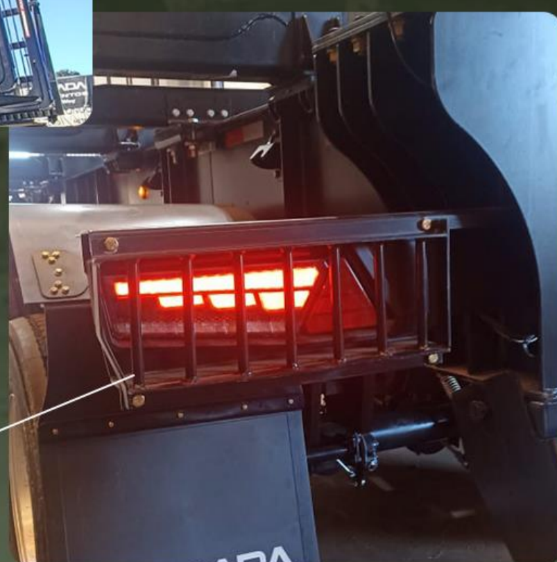
Lanternas de LED com proteção