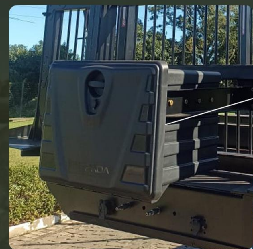
Caixa de ferramentas